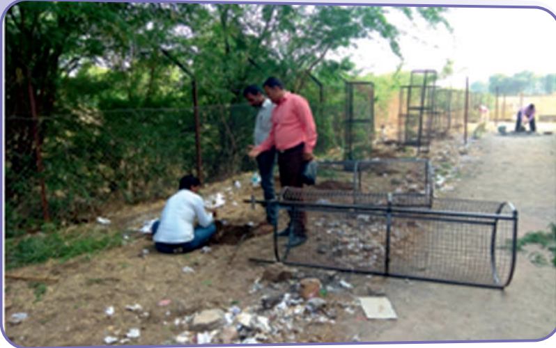
महाविद्यालय परिसरात वृक्षारोपन करतांनाचे क्षणचित्र