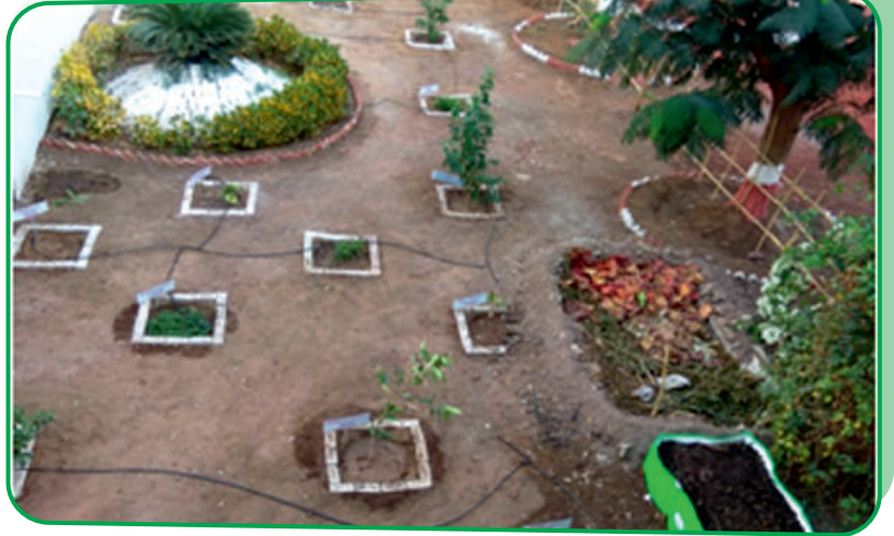
महाविद्यालय परिसरात औषधी वनस्पतींचे झालेले वृक्षारोपन