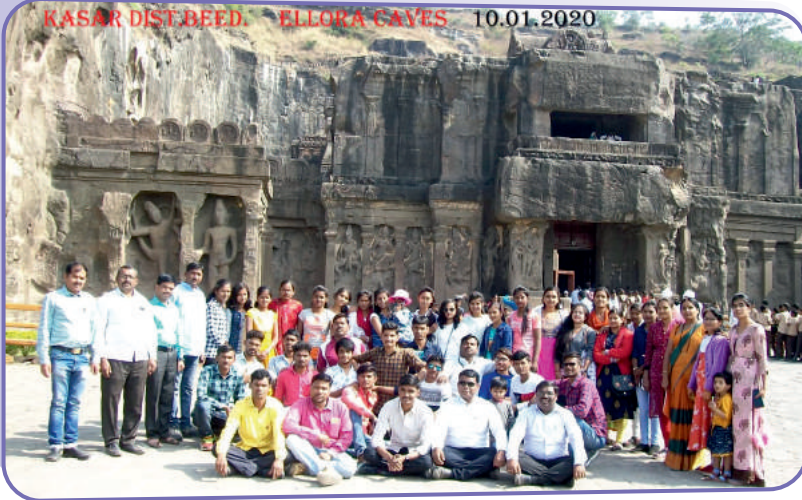
महाविद्यालयाची वेरुळ-अजिंठा येथील शैक्षणिक सहल