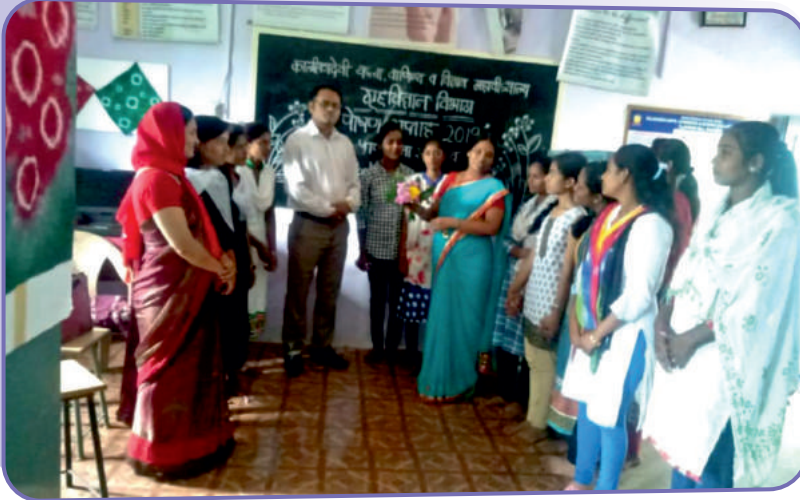
गृहशास्त्र विभाग आयोजित पोषण सप्ताहाची क्षणचित्रे