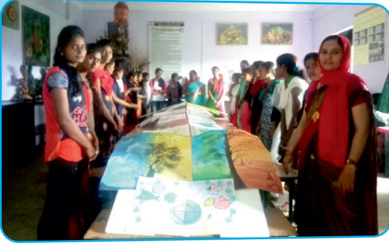
गृहशास्त्र विभाग आयोजित पोस्टर स्पर्धा