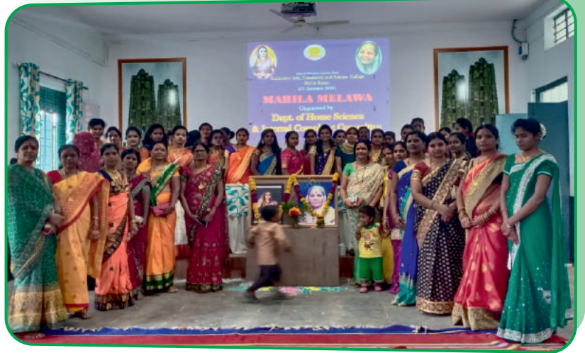
मकर संक्रांतीनिमित्त महाविद्यालय आयोजित महिला पालक मेळावा व हळदी-कुंकू कार्यक्रमात सहभागी महिला