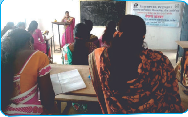
शिरूर कासार परिसरातील महिलांना महाविद्यालय व जिल्हा उद्योग केंद्रामार्फत आयोजित प्रशिक्षण कार्यशाळेत सहभागी महिला