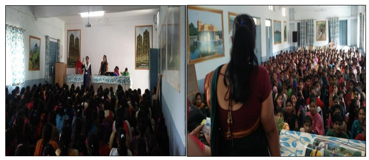
Organized Adolescent Interaction Program During World Nutrition Week 1/09/2018-09/09/2018

Conducted a 'Self Hygiene during Menstruation Cycle Period Program' for junior and senior college students on 27/09/2018. Representatives of 'UmedAbhiyan' of Indian Government from Shirur (Ka) visited our college to bring awareness regarding 'Use of Sanitary Napkin' during menstruation period. This program was known as 'AsmitaYojana' which provided napkins to adolescent girls with concession after taking the card of AsmitaYojana in only five rupees. During this program we tried to bring awareness regarding self hygiene and importance of sanitary napkins for better hygiene and health of adolescent girls along with special care to be taken regarding food and nutrition. For this program more than 80 students of junior and senior college along with junior college female staff and home science department faculty members were present.