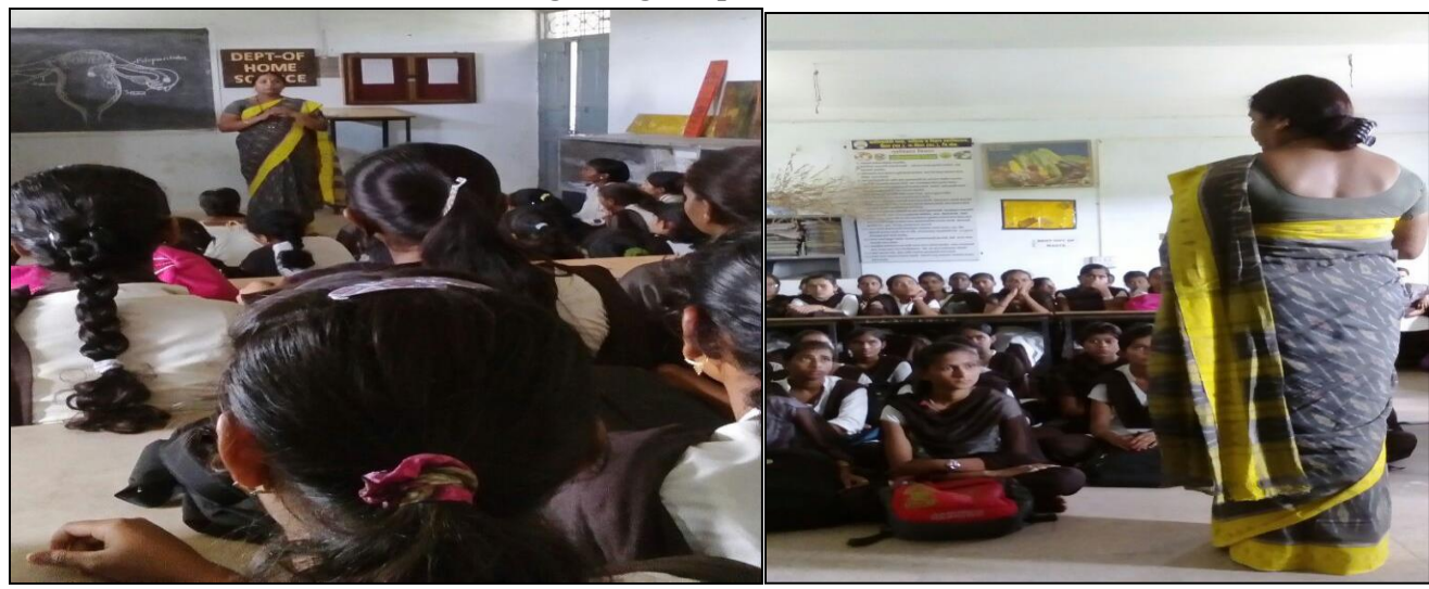
School student Interaction Program 06/09/2018