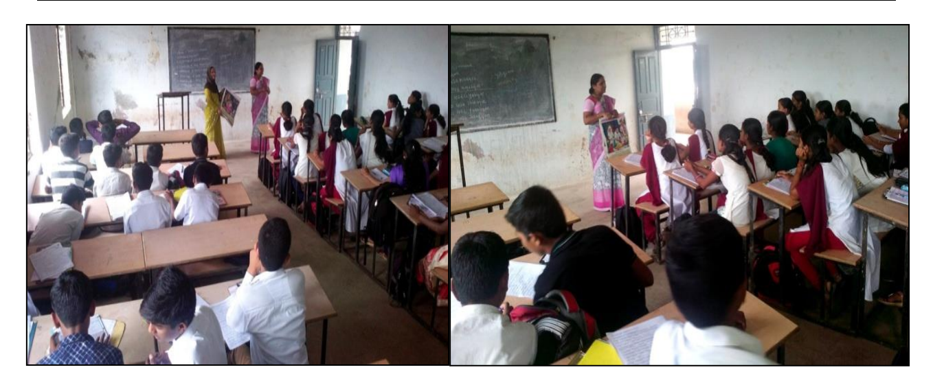
Interaction with Adolescents Regarding, 'Reproductive Health and Nutrition' 07/09/2018