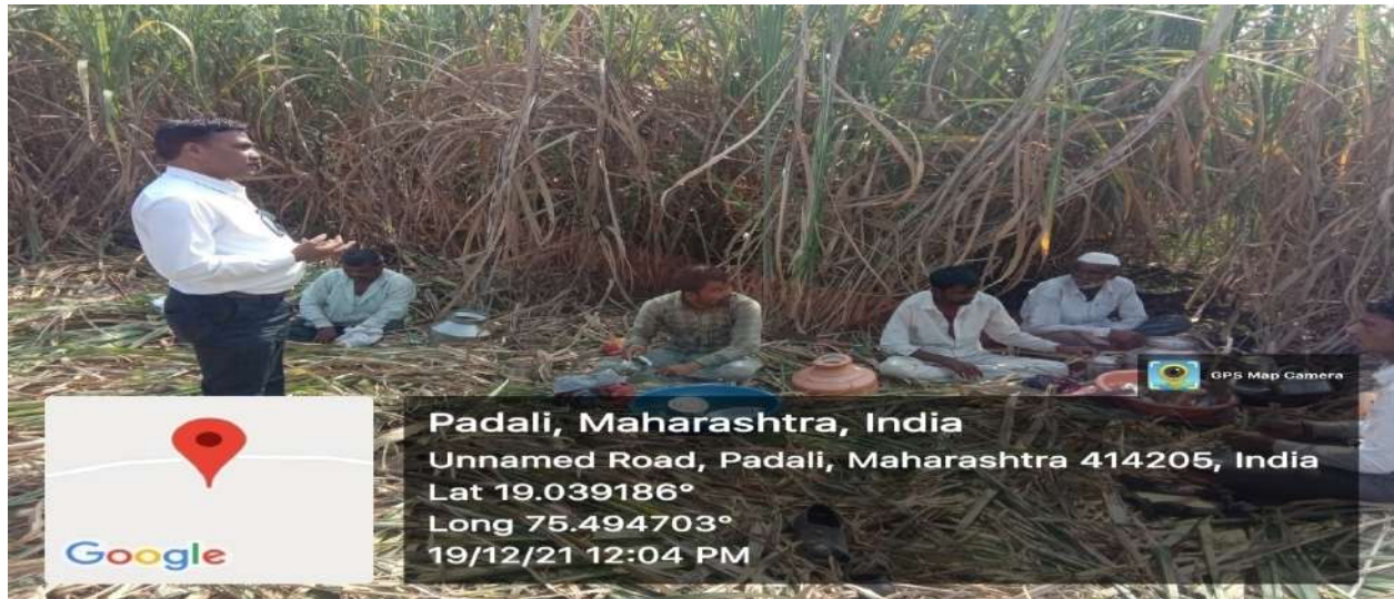
HOD Dep of Pub-Administration visit for Sugarcane worker in padali village dialogue with Higher Education issues Date -19-12-2021