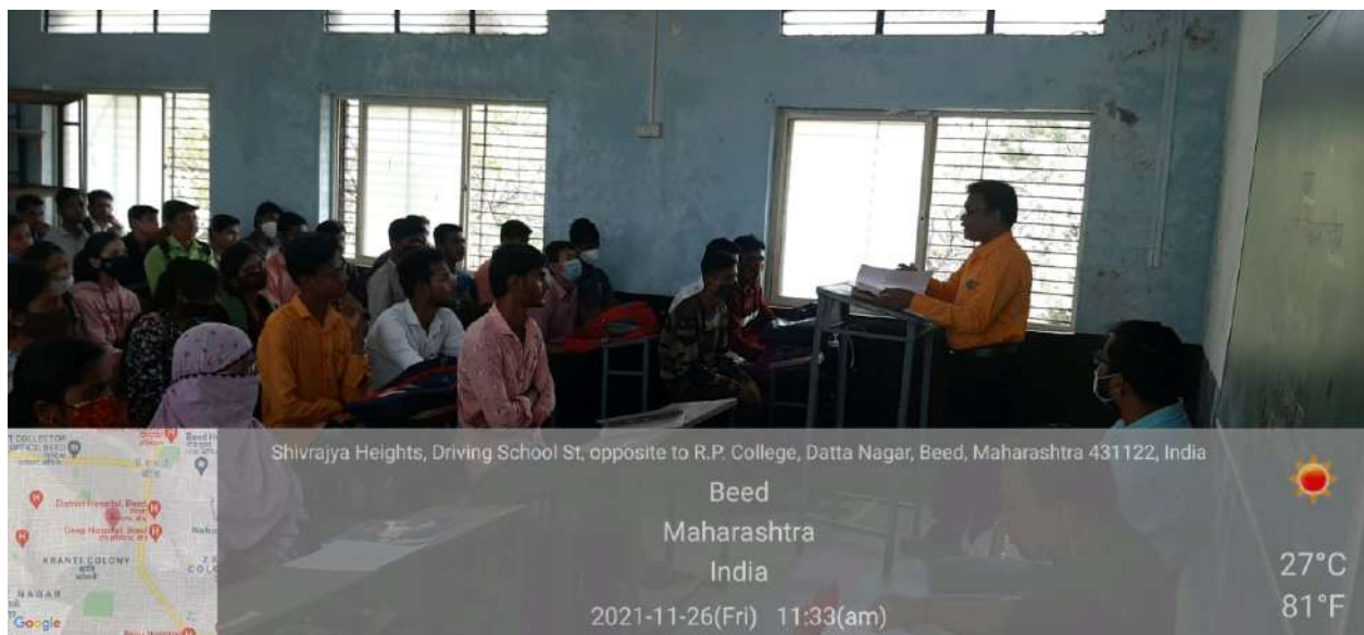
Guest lecture on Indian constitution day (Sub- Bhartiya samaj & Constitutional Culture) in KSK College, Beed. Date – 26-11-2021